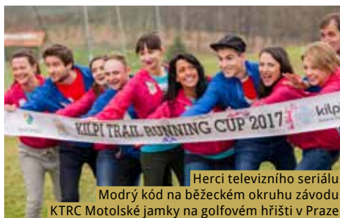
Herci televizního seriálu Modrý kód na běžeckém okruhu závodu KTRC Motolské jamky na golfovém hřišti v Praze