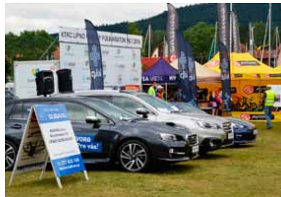
O flotilu Subaru je zájem. V epicentru každého závodu najdete vozy Subaru, které si můžete důkladně prohlédnout

Na všech závodech se koná doprovodný pětikilometrový závod, který zvládne i „zbytek rodiny s dítětem“, zatímco se její nejsportov-