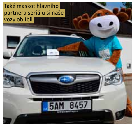
Také maskot hlavního partnera seriálu si naše vozy oblíbil

nější reprezentant bude tužit na hlavní trase. „Pro děti zajistíme hlídání i atletické školičky,“ doplňují pořadatelé.