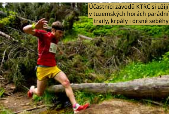
Účastníci závodů KTRC si užijí v tuzemských horách parádní traily, krpály i drsné seběhy